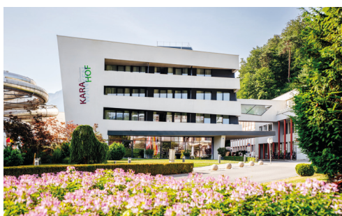
Thermenhotel Karawankenhof ****